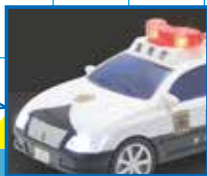
ボタンを押すとヘッドライトと警告灯が点滅します